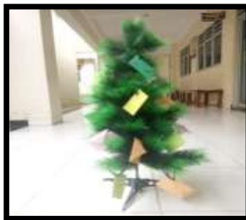
Gambar 2.1 Media Pohon terpadu