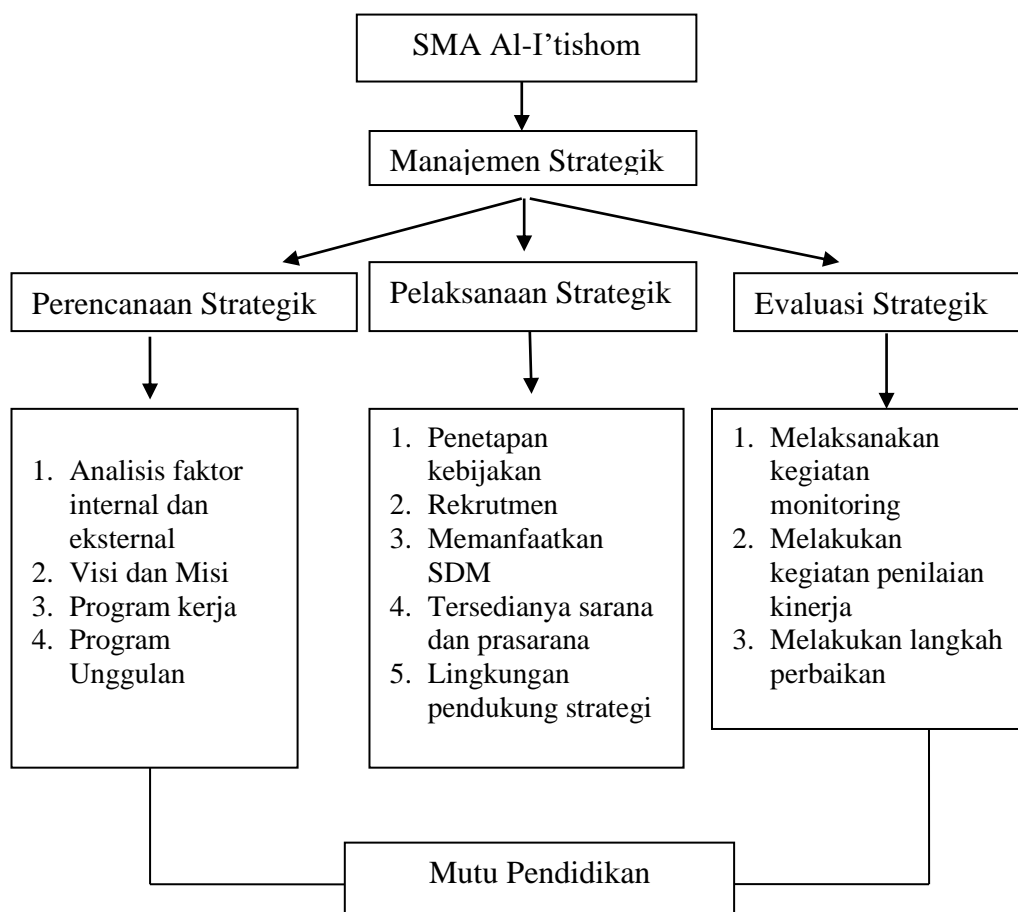
Gambar 2.1 Proses Manajemen Strategik

Dari bagan kerangka berfikir yang telah disajikan diatas, maka dapat diberikan gambaran bahwa untuk menghadapi situasi kondisi yang ada didalam masyarakat dengan bermunculnya lembaga pendidikan baru atau sekolah sekolah baru tentunya membuat persaingan antara sekolah satu dengan yang lain akan semakin meningkat, sehingga dalam hal ini kepala sekolah, dituntut untuk bisa menerapkan strategi yang unggul sehingga strategi tersebut bisa dijadikan cara untuk mempertahankan eksistensi