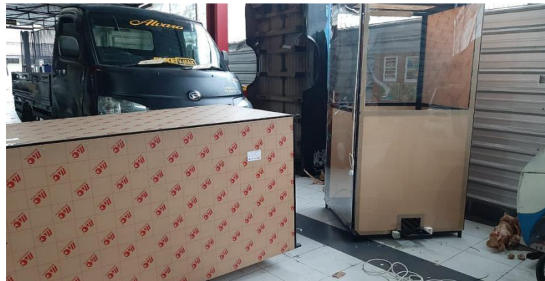
Gambar 3.11. Proses Finishing