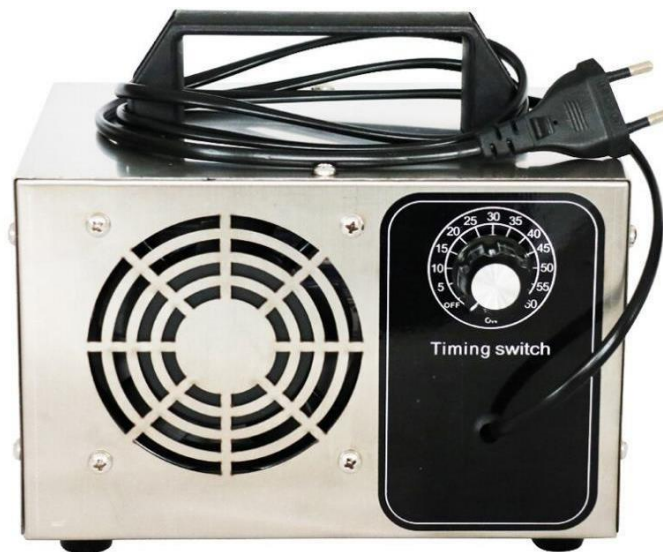
Gambar 3.3. Ozon generator

Ozon generator yang digunakan pada proyek ini adalah Ozon Generator Sterilizer Timing Switch yang mampu menghasilkan Ozon hingga 24 gram perjam. Pembangkit ozon ini berukuran 200 x 180 x 140 mm dengan berat 1645 gram dan menggunakan arus listrik AC 220V sebagai sumber tenaganya. Ozon generator yang digunakan disajikan pada Gambar 3.3.