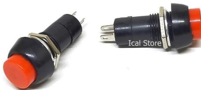
Gambar 3.6. Saklar push On-Off Locking

Saklar yang digunakan pada proyek ini adalah saklar Push On-Off Locking dengan diameter 12 mm, sebagaimana disajikan pada Gambar 3.6.