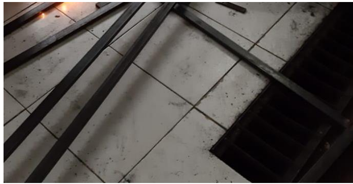
Gambar 3.1. Material rangka

Rangka bilik sterilisasi dibuat dari baja kotak dengan ukuran 10mm x 30mm dengan tebal 1mm. Material ini juga digunakan sebagai lantai dasar yang disusun sejajar. Baja kotak yang digunakan disajikan pada Gambar 3.1.