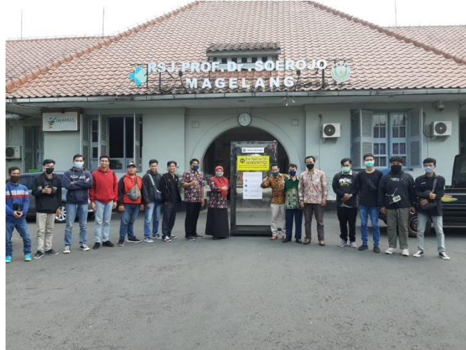
Gambar 3.13. Sosialisasi cara penggunaan dan perawatan bilik

Sosialisasi dilakukan pada 18 Mei 2020 di Rumah Sakit Jiwa Prof. Dr. Soerojo Magelang, sebagaimana disajikan pada Gambar 3.13.