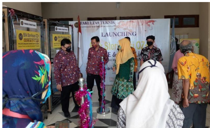
Gambar 3.12. Launching bilik sterilisasi oleh Rektor Universitas Muhammadiyah Magelang

Launching dan publikasi dilakukan pada 6 Mei 2020. Dihadiri oleh Rektor Universitas Muhammadiyah Magelang, Dekan Fakultas Teknik, Kaprodi di lingkungan Fakultas Teknik, dan segenap awak media, sebagaimana disajikan pada Gambar 3.12.