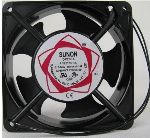
Gambar 3.7. Exhaust Fan

Exhaust Fan yang digunakan pada proyek ini adalah Exhaust Fan DP200A 2123XBL dengan ukuran 120 x 120 x 38 mm dan menggunakan arus AC 220V, sebagaimana disajikan pada Gambar 3.7.