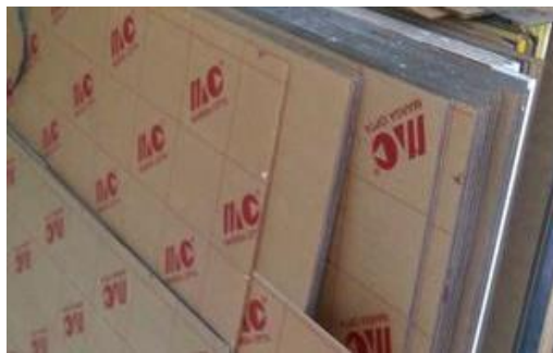
Gambar 3.2. Acrylic sebagai papan penutup

Bilik sterilisasi ditutup menggunakan Acrylic untuk menutupi bagian bilik meliputi bagian samping kanan dan kiri, belakang, depan atau pintu, dan atas dengan tebal 1,5 mm. Acrylic dipilih karena transparan, ringan, dan mudah dikerjakan. Acrylic yang digunakan disajikan pada Gambar 3.2.