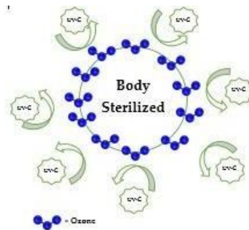
Gambar 2.2. UV-C light tidak akan bisa tembus permukaan yang telah terpapar OZO