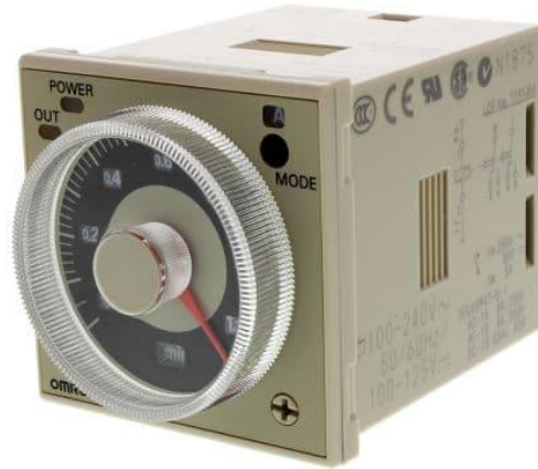
Gambar 3.5. Relay timer .

Relay yang digunakan pada proyek ini adalah relay timer H3CR-A8. Digunakan untuk mengatur timing penyalaan lampu ultraviolet, disajikan pada Gambar 3.5.