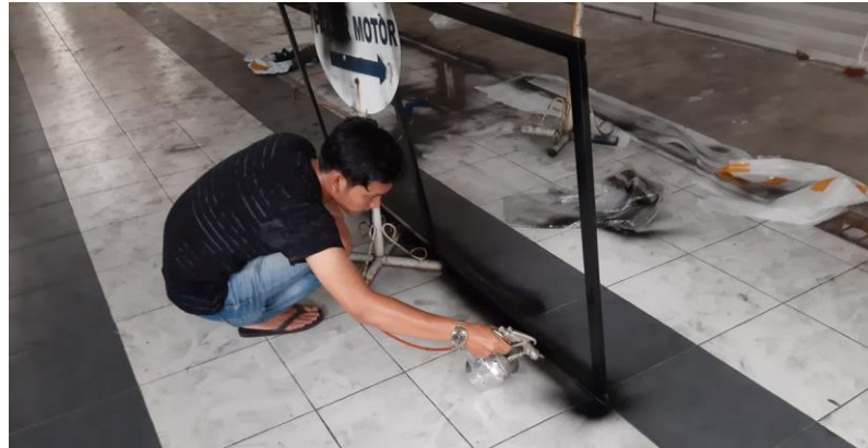
Gambar 3.10. Proses pengecatan rangka bilik.