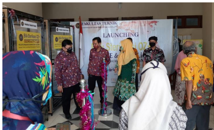
Gambar 3.12. Launching bilik sterilisasi oleh Rektor Universitas Muhammadiyah Magelang.

Launching dan publikasi dilakukan pada 6 Mei 2020. Dihadiri oleh Rektor Universitas Muhammadiyah Magelang, Dekan Fakultas Teknik, Kaprodi di lingkungan Fakultas Teknik, dan segenap awak media, sebagaimana disajikan pada Gambar 3.12.