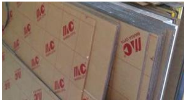
Gambar 3.2. Acrylic sebagai papan penutup.

Bilik sterilisasi ditutup menggunakan acrylic untuk menutupi bagian bilik meliputi bagian samping kanan dan kiri, belakang, depan atau pintu, dan atas dengan tebal 1,5 mm. Acrylic dipilih karena transparan, ringan, dan mudah dikerjakan. Acrylic yang digunakan disajikan pada Gambar 3.2.