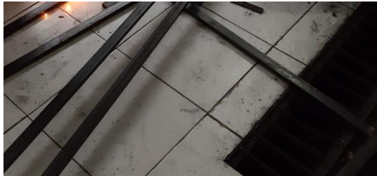
Gambar 3.1. Material rangka.

Rangka bilik sterilisasi dibuat dari baja kotak dengan ukuran 10 mm x 30 mm dengan tebal 1mm. Material ini juga digunakan sebagai lantai dasar yang disusun sejajar. Baja kotak yang digunakan disajikan pada Gambar 3.1.