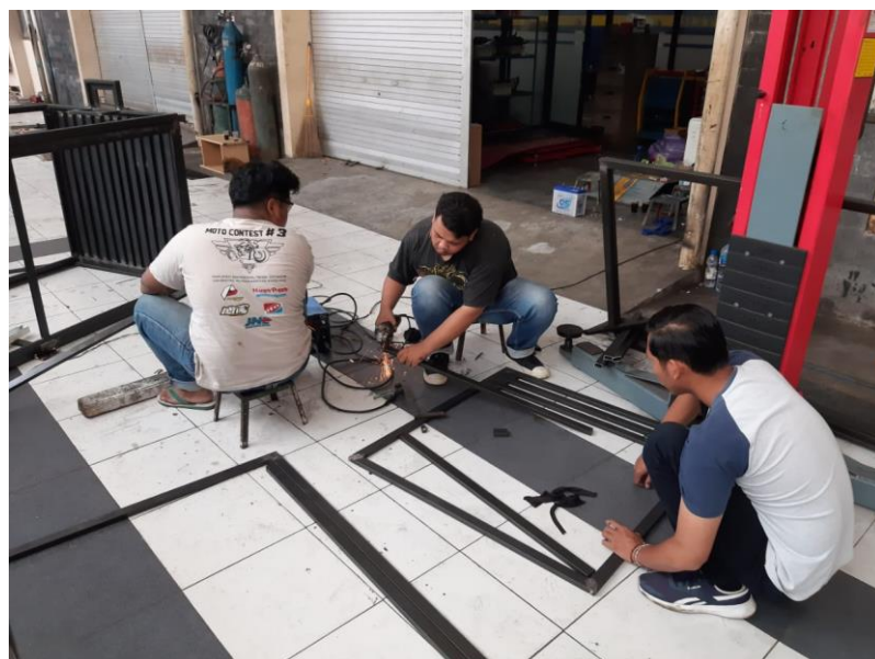
Gambar 3 9. Proses pemotongan besi sebagai rangka bilik.

Pembuatan bilik desinfektan dimulai dari proses pemotongan besi sebagai rangka bilik. Pemotongan besi diukur sesuai ukuran setiap rangka bilik menggunakan gerinda tangan. Setelah dipotong, setiap bagian rangka bilik dilakukan proses pengecatan menggunakan cat besi semprot. Dilanjutkan dengan proses pengelasan untuk menghubungkan rangka menggunakan las listrik. Setelah rangka bilik telah jadi, dipasangkan papan acrylic sebagai penutup setiap bagian bilik. Dilanjutkan dengan proses finishing yang meliputi pemasangan UV-C lamp , Ozone generator , exhaust fan , serta rangkaian kelistrikan. Proses pemotongan baja, pengecatan, dan finishing disajikan pada Gambar 3.9., 3.10., 3.11.