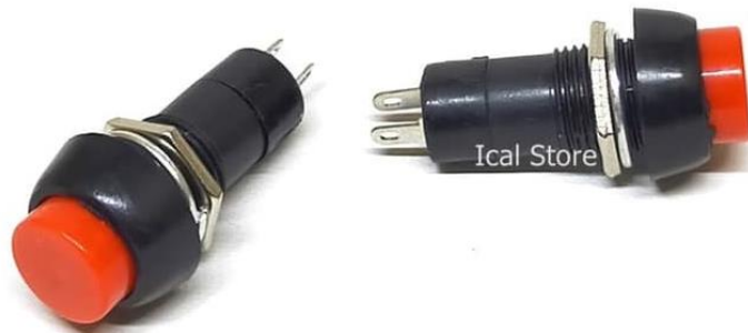
Gambar 3.6. Saklar push on-off locking .

Saklar yang digunakan pada proyek ini adalah saklar push on-off locking dengan diameter 12 mm, sebagaimana disajikan pada Gambar 3.6.