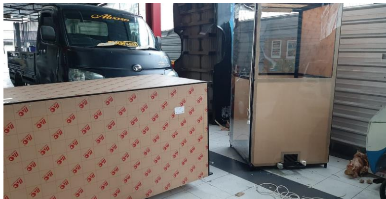
Gambar 3.11. Proses finishing.