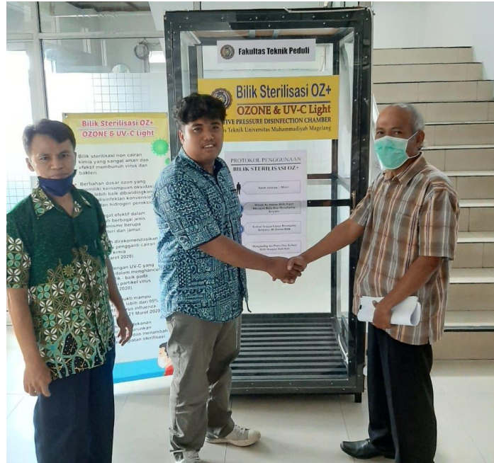
Gambar 3.13. Sosialisasi cara penggunaan dan perawatan bilik.

Sosialisasi dilakukan pada 18 Mei 2020 di RSUD Budi Rahayu Kota Magelang, sebagaimana disajikan pada Gambar 3.13.