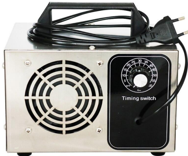
Gambar 3.3. Pembangkit ozon.

Pembangkit ozon yang digunakan pada proyek ini adalah Ozone Generator Sterilizer Timing Switch yang mampu menghasilkan ozon hingga 24 gram perjam. Pembangkit ozon ini berukuran 200x180x140mm dengan berat 1645 gram dan menggunakan arus listrik AC 220V sebagai sumber tenaganya. Pembangkit ozon yang digunakan disajikan pada Gambar 3.3.