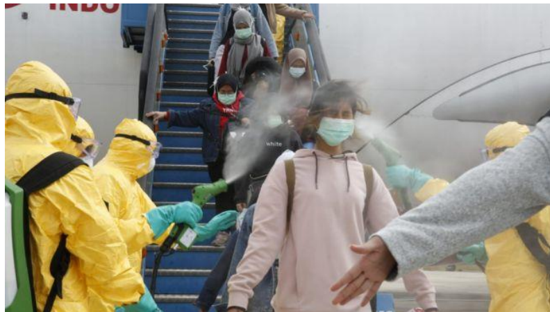
Gambar 1.1. Penyemprotan cairan desinfektan yang tidak sesuai peruntukannya ( Arif, 2020 ).

Health Organization (WHO) tidak menyarankan penggunaan alkohol dan klorin ke seluruh permukaan tubuh (seperti ditunjukkan pada Gambar 1.1.) karena akan membahayakan pakaian dan membrane mukosa tubuh seperti mata dan mulut ( World Health Organization (WHO), 2020 ). Sebanyak 73.262 perawat wanita yang rutin tiap minggu menggunakan desinfektan untuk membersihkan permukaan alat-alat medis beresiko lebih tinggi dalam mengalami kerusakan paru-paru kronik ( Dumas et al., 2019 ).