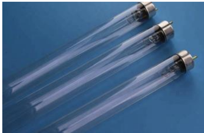
Gambar 3.4. Lampu ultraviolet.

Lampu ultraviolet yang digunakan pada proyek ini adalah UV-C lamp G20T10 UV-C Germicidal TUV dengan daya 8-20 watt dengan arus AC 220V, sebagaimana disajikan pada Gambar 3.4.