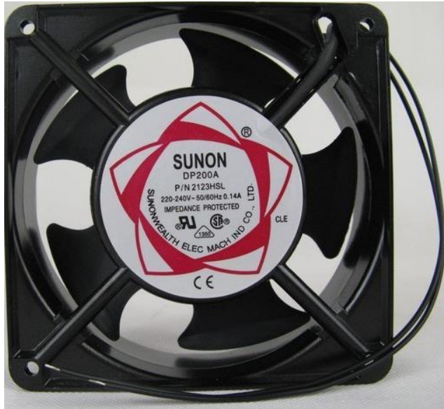
Gambar 3.7. Exhaust Fan.