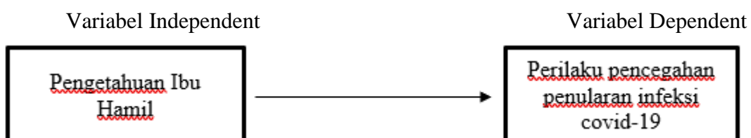
Gambar 3.1 Skema Kerangka Konsep Penelitian

Variabel terikat merupakan variabel yang dipengaruhi dan menjadi akibat karena adanya variabel bebas (Sastroasmoro & Ismail, 2014). Variabel terikat dalam penelitian ini adalah perilaku pencegahan penularan infeksi COVID-19.