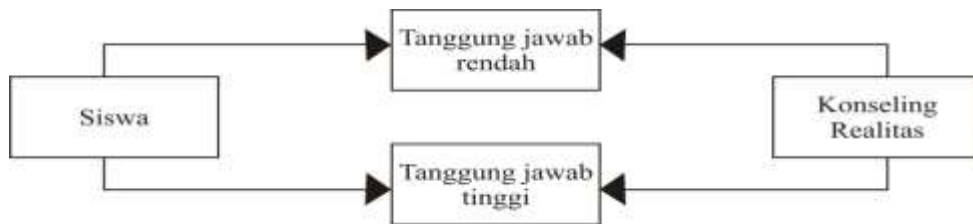
Gambar 1 Kerangka Berfikir

mencerminkan jenis dan jumlah rumusan masalah yang perlu dijawab melalui penelitian. Kerangka berfikir yang digunakan dalam penelitian ini adalah :