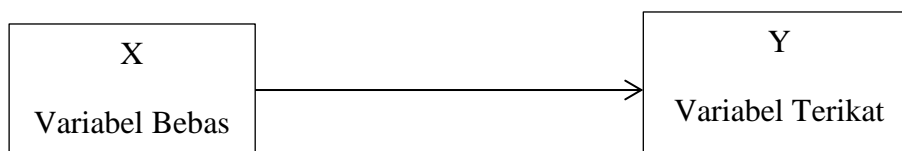
Gambar 2 Hubungan antar variabel

Variabel X mempengaruhi variabel Y. Layanan bimbingan kelompok dengan teknik self management merupakan variabel bebas (X) yang mempengaruhi pemahaman tentang kemandirian siswa sebagai variabel terikat (Y).